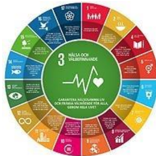
Bilden beskriver hur mål 3 hänger ihop med samtliga mål som på olika sätt berör underliggande orsaker till hälsa och ohälsa.

Den 14 juni 2018 beslutade regeringen om Sveriges handlingsplan för Agenda 2030. Med handlingsplanen vill regeringen stärka arbetet med att genomföra agendan och göra det tydligt hur myndigheter och andra samhällsaktörer kan bidra.