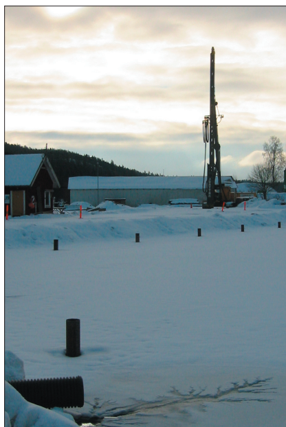
Plintar för bryggan har anlagts längs med strandkanten vid sjöboden.

En ny brygga anläggs längs stranden utanför sjöbodarna. Redan till sommaren kommer rederierna att flytta tillbaka dit från den temporära bryggan vid den södra delen av området.