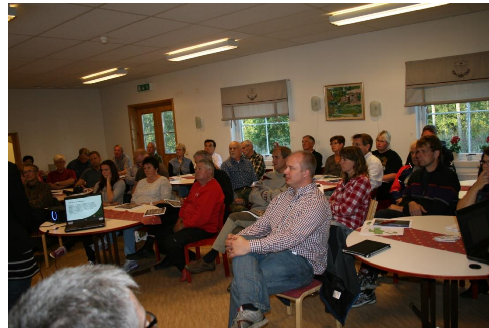
Ideseminarium/Samrådsmöte i Gustavsfors 2012