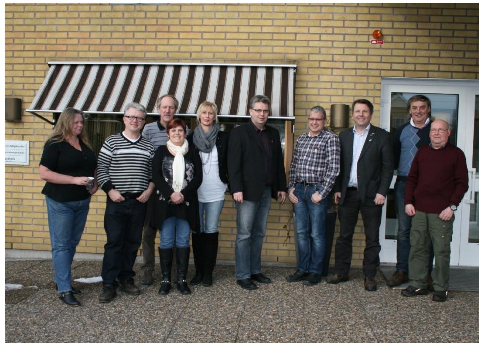
Kommunstyrelsen i februari 2012

Översiktsplanens strategiska frågor har stämts av i Kommunstyrelsen som även fattat beslut om att samråd ska genomföras.