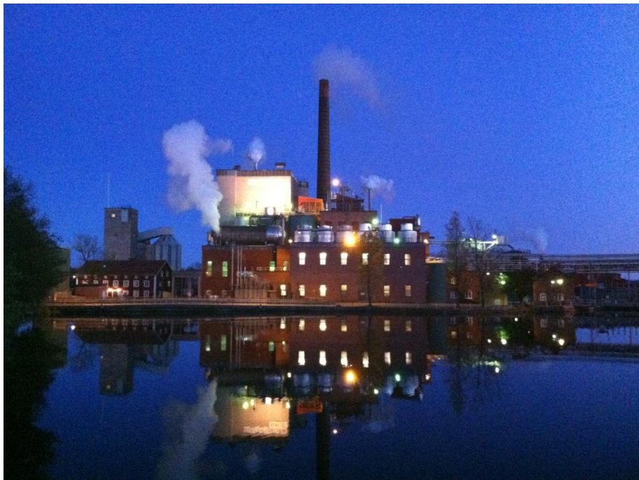
Munksjö Paper i Billingsfors

Planberedskap är en förutsättning för att kunna erbjuda god tillgång på byggbar mark för verksamheter av olika slag.