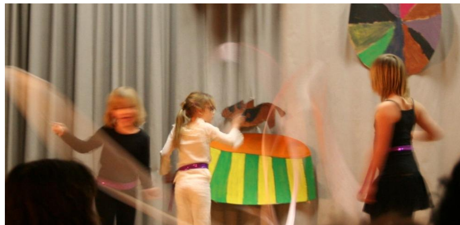
Cirkus på Bäckeskolan

År 2030 har förhoppningsvis den negativa befolkningsutvecklingen vänt eller åtminstone planat ut. Detta genom att fler människor aktivt väljer att bosätta sig i Bengtsfors kommun för att få en hög livskvalitet. Det är inte bara människor som har sina rötter i kommunen som återvänder, utan också norrmän och nordeuropéer som hittat till Dalsland som turister. Människor som invandrat till Sverige byter gärna arbetslöshet och otrygghet i storstädernas miljonprogramsområden mot möjlighet till bra arbeten, skola och bostäder i Bengtsfors kommun. Nu stannar yngre kvar i kommunen på grund av de utbildnings-, utvecklings- och karriärmöjligheter som erbjuds. Unga som flyttat ut för exempelvis studier kommer med sina familjer tillbaka till en attraktiv bostadsort. Tack vare bra kommunikationer är Bengtsfors kommun även en möjlig och prisvärd bostadsort för dem som arbetar i Göteborg och Karlstad. Äldre människor vill bo i kommunen med den trygghet, service och närhet som erbjuds.