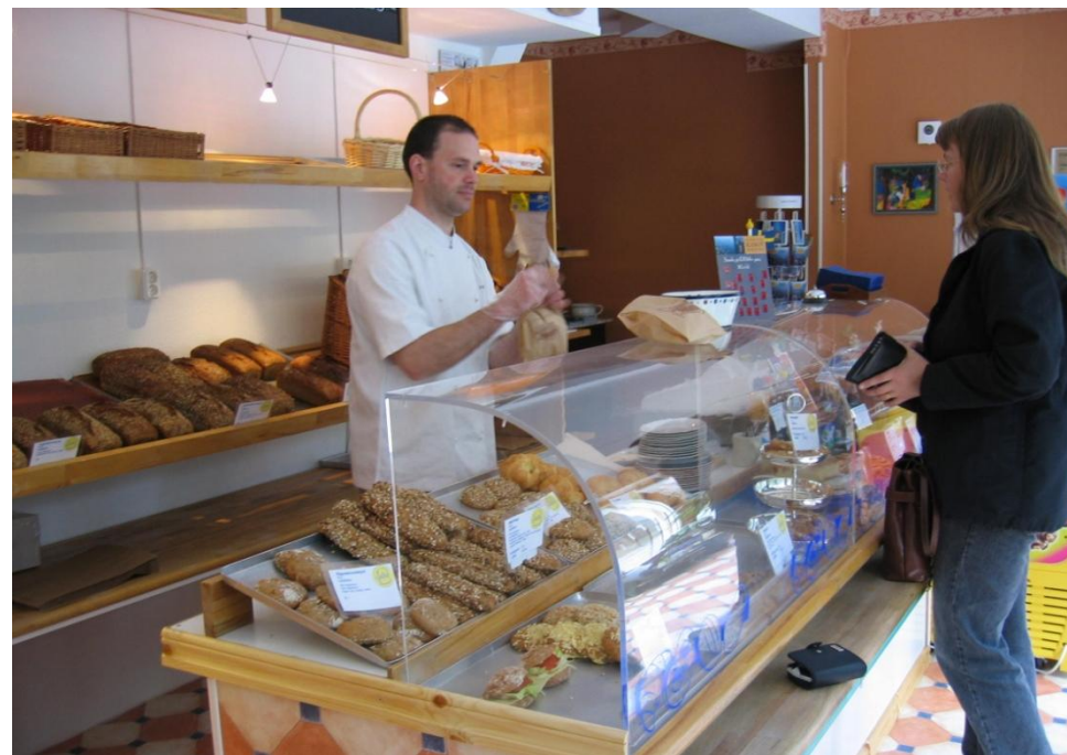
Svens Kopparkittel i Gustavsfors

under hela året har ökat. Allt fler anläggningar som drar besökare har skapats och begreppet ”byggd turism” ger underlag för ett ökande antal arbetstillfällen. Anläggningarna är en väsentlig anledning till att besökarna stannar längre och under sin vistelse här spenderar betydligt mera än förr. Besöksnäringens kontinuerligt ökade betydelse är bland annat frukten av ett långsiktigt strategiskt samarbete inom Dalsland. Den har med tiden dessutom fått allt större betydelse för kommuninvånarnas egen identitet och trivsel.